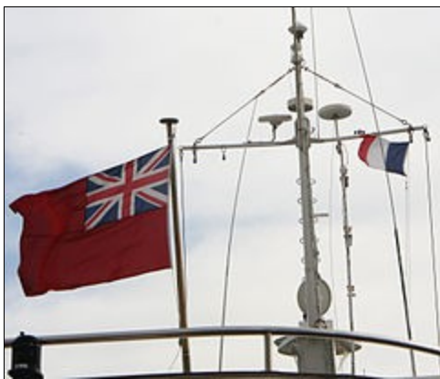
Superyacht Ariane NI dans le port de Toulon, battant son pavillon britannique et un drapeau de courtoisie français

*hampe: manche ou support souvent en bois auquel on fixe un drapeau *frappé: attaché